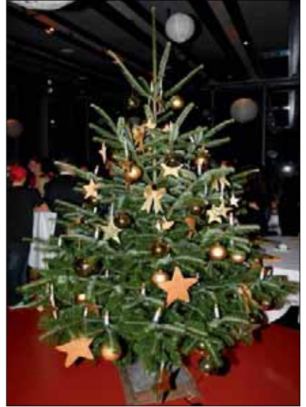
Weihnachtsfeier SPZ Nottwil (23.11.13)