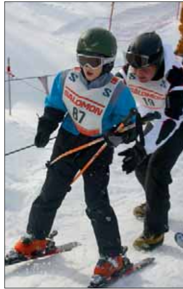
Skirennen Hasliberg (1.2.14)