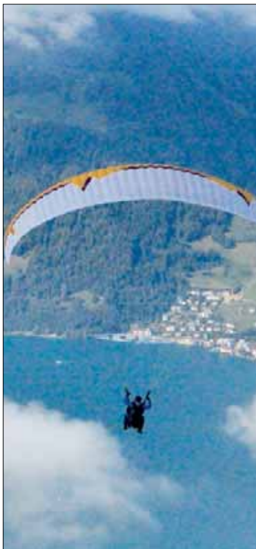
Polierausflug Emmetten (13.9.14)